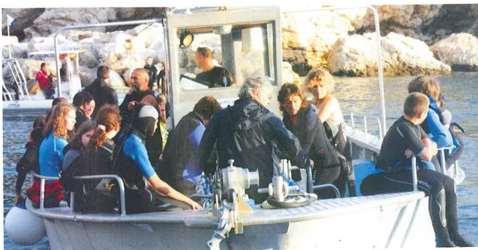
En route pour la plongée: une délicieuse attente!

Après une très belle soirée pour tout le monde ainsi qu'une plongée d'exploration matinale pour les volontaires, les valises se rangent, les camions se chargent, le centre se vide. À l'année prochaine! ■